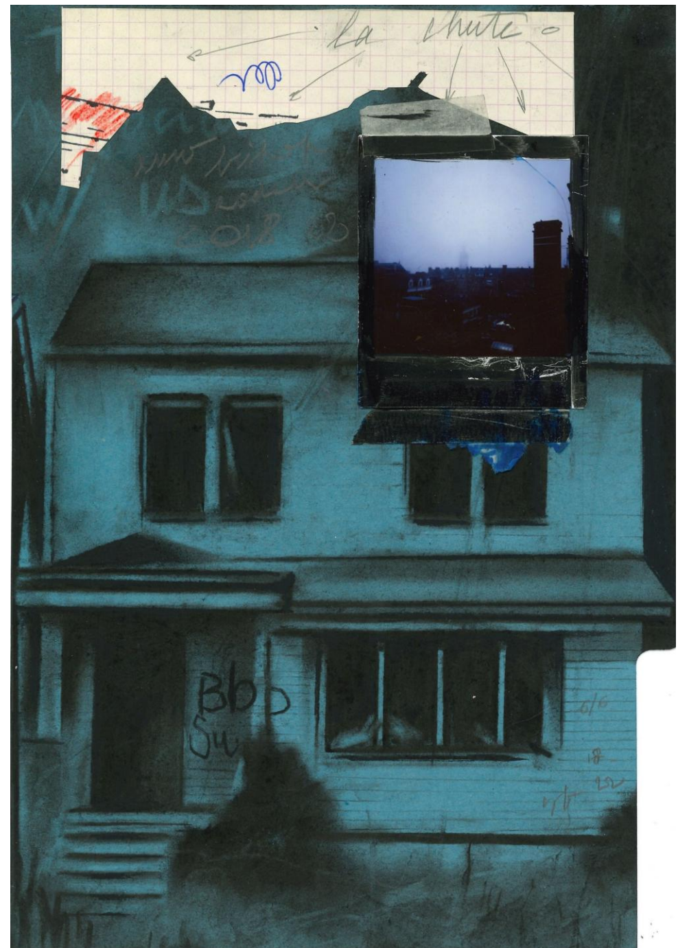
Amo Bishop Roden #6, 2022 , fusain, Polaroid, collage et ruban adhésif sur papier, 29,7 x 21 cm, collection privée, Paris