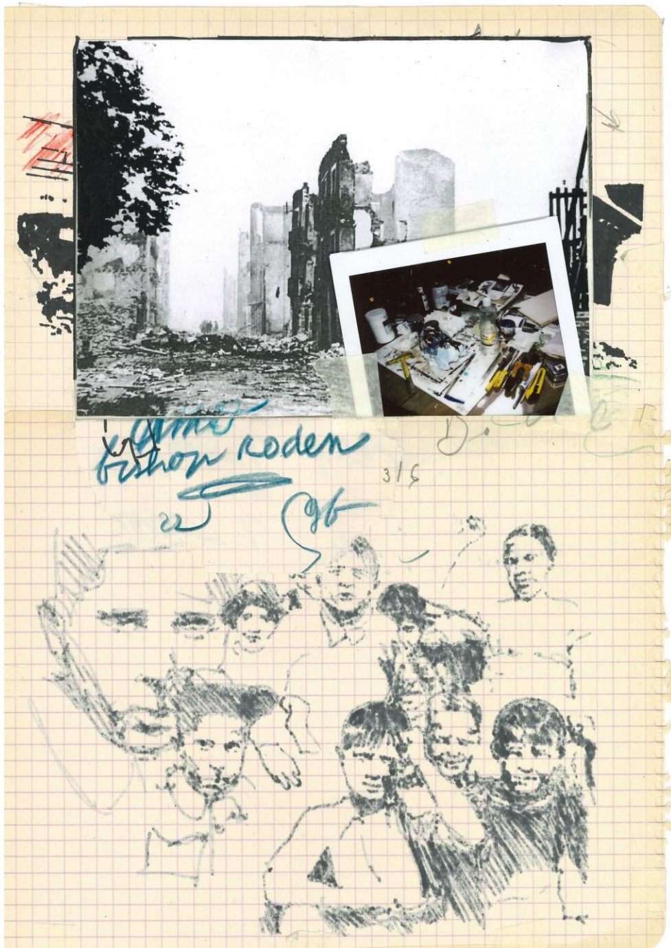
Amo Bishop Roden #3, 2022 , marqueur, crayon de couleur, photocopie, Polaroid et ruban adhésif sur papier, 29,7 x 21 cm, collection privée, Paris