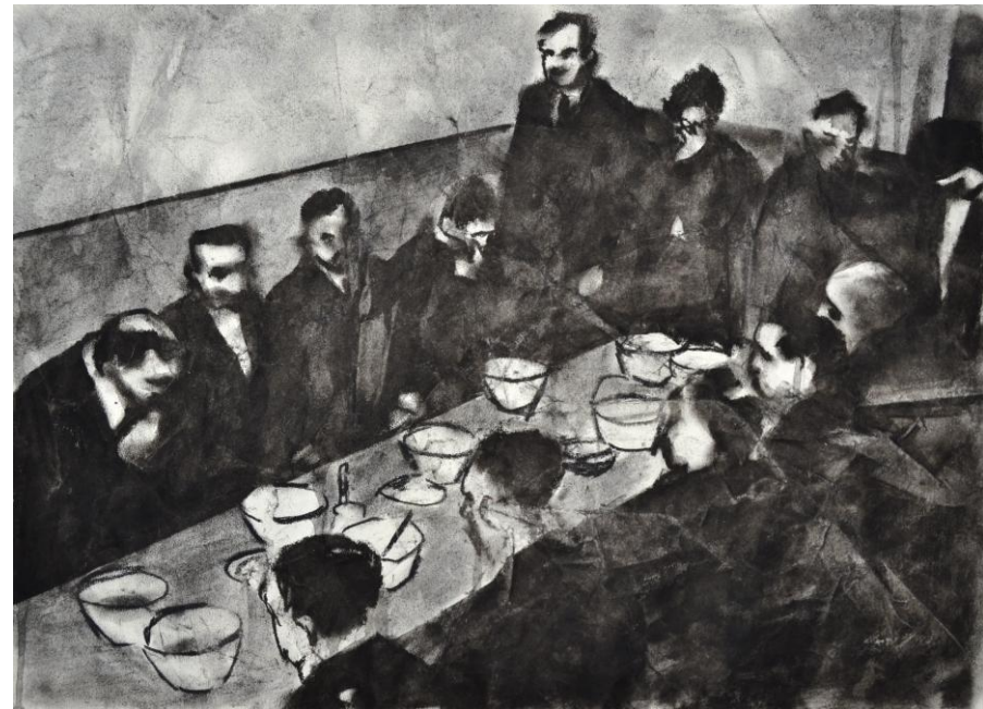
Splendeur et misère no.1/2/3/5, 2024 – 2025 fusain et encre de Chine sur papier noyé, 29,7 x 42 cm