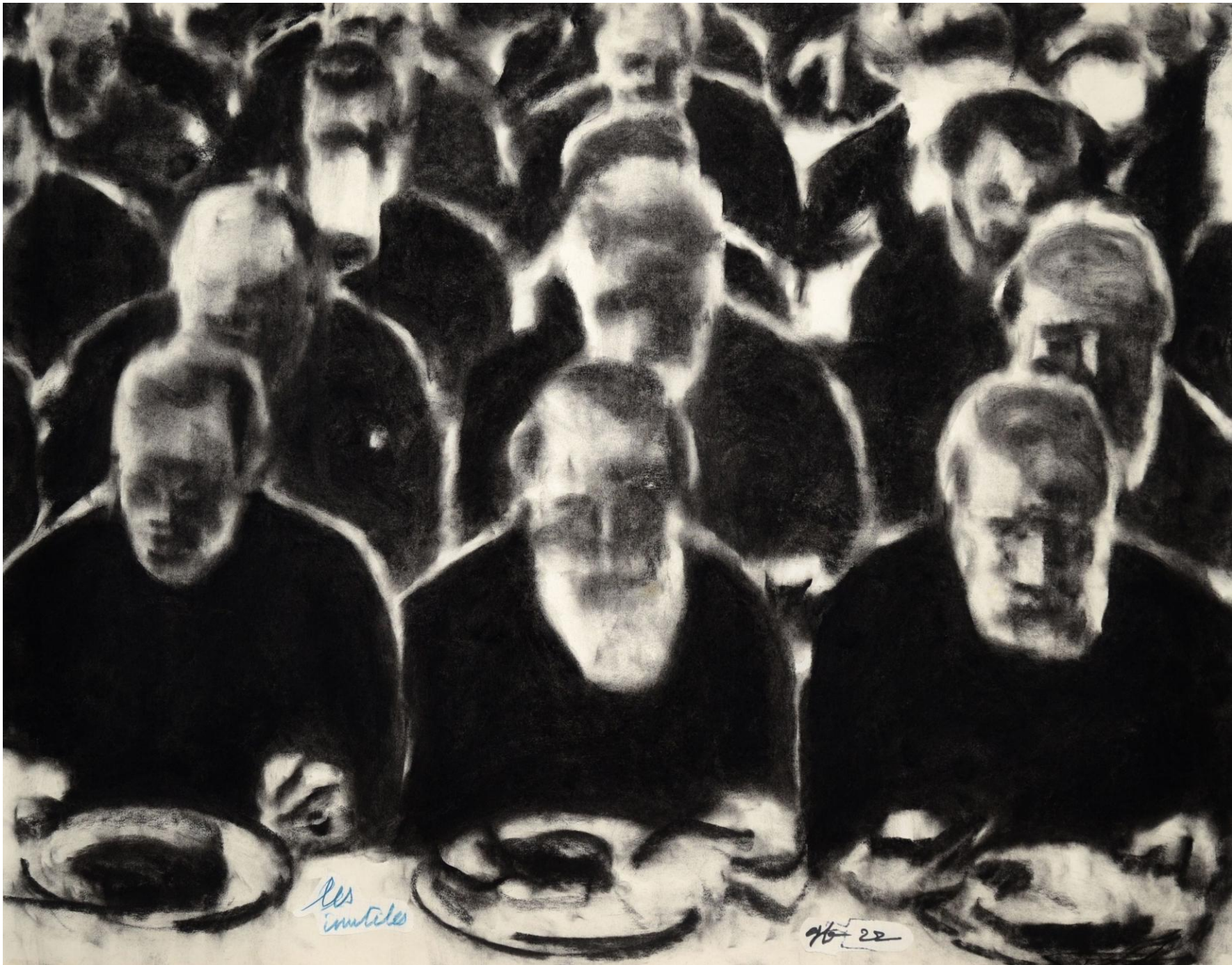
Les Inutiles, 2022, fusain sur papier peint, 53 x 67 cm, collection privée, Paris