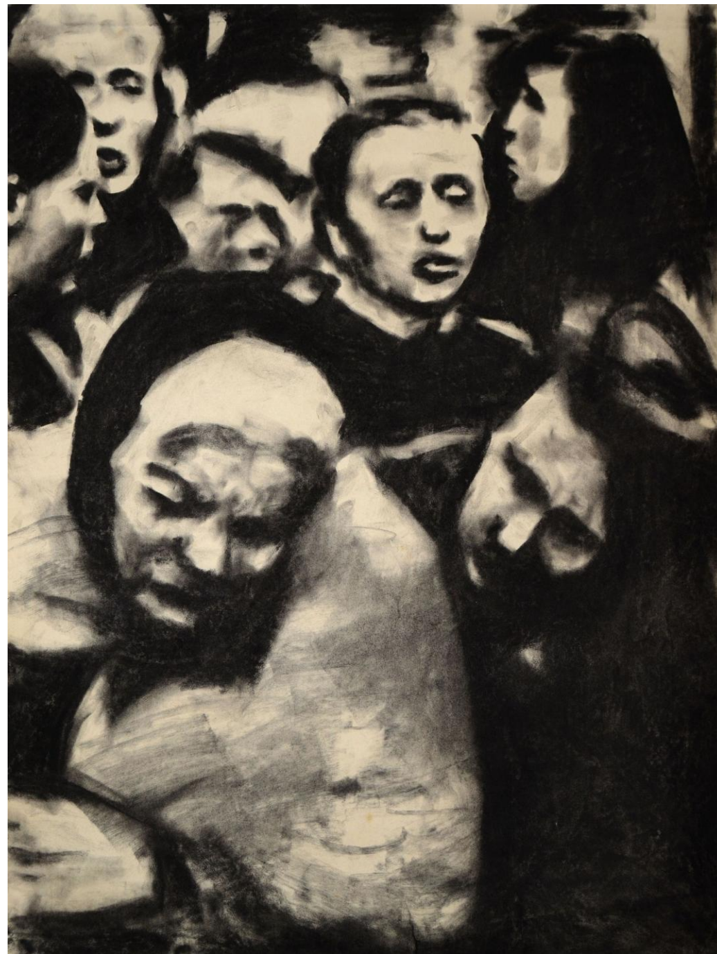
Sans titre (L'exode), 2022, fusain sur papier peint, 68 x 53 cm, collection Musée Jenisch Vevey, Suisse (CH)