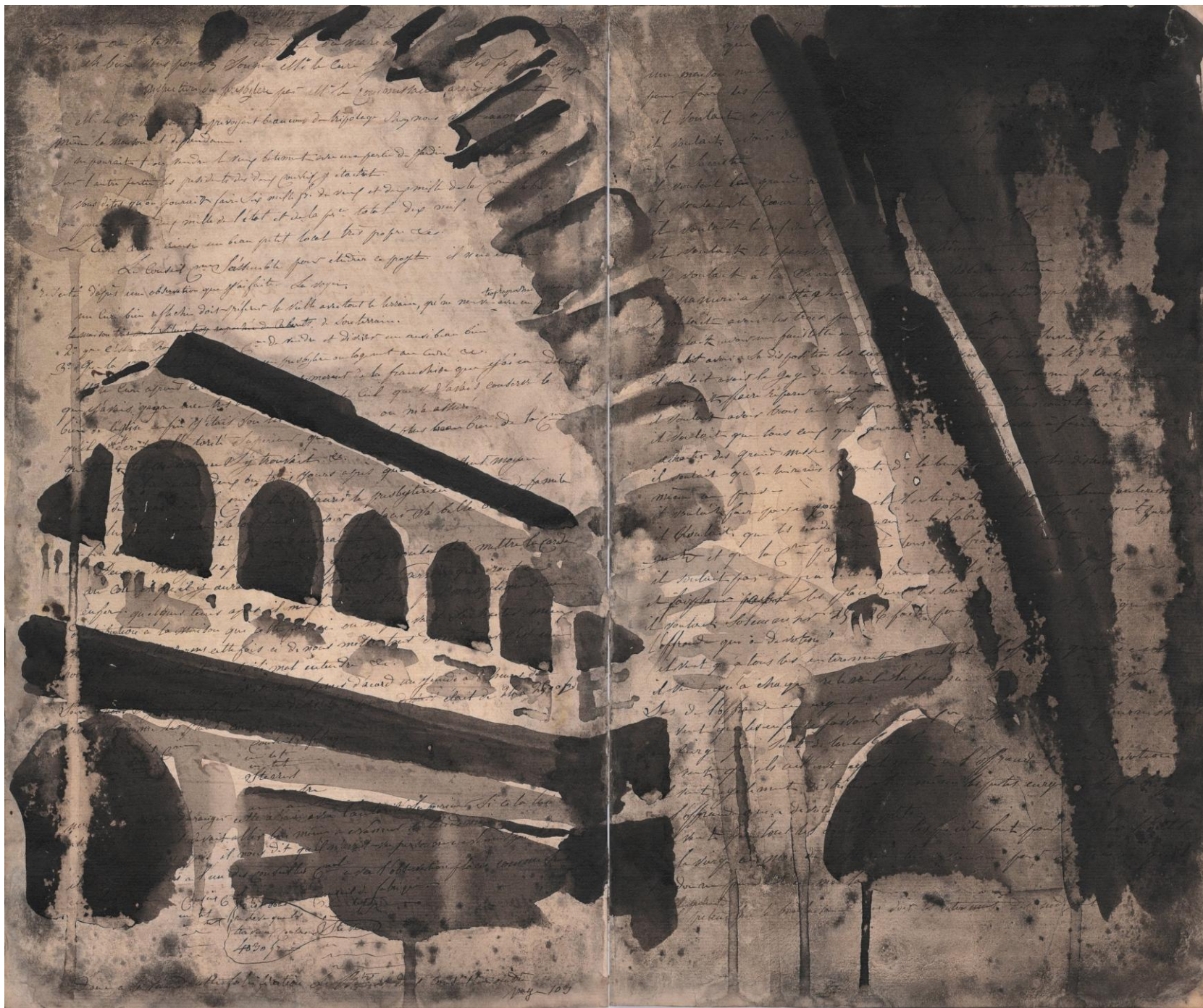
Real Alcazar de Sevilla (Cartographies visuelles de l'Andalousie), 2025, encre de Chine et brou de noix sur papier ancien, 35,7 x 42,8 cm Avec le soutien de l'ADAGP (Dotation Temps de recherche artistique, automne 2025)